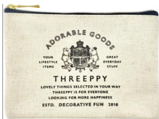
↑ THREEPPY オリジナルポーチ