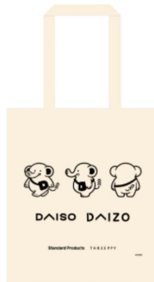
↑ だいぞうトートバッグ