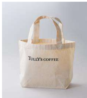
<オープン記念バッグ> 税込 1,500 円