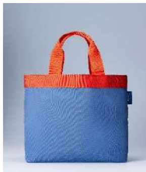
<オープン記念バッグ> 税込 3,000 円