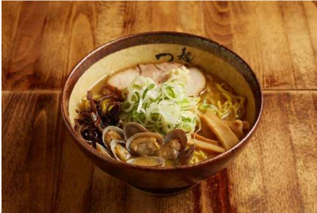
あさり味噌ラーメン

「麺屋つくし」の冷凍自動販売機が登場！つくしの代名詞であり原点の「味噌ラーメン」をはじめ、月替わりで「塩」、「醤油」、「辛みそ」、「中華そば」、そして冷凍自販機限定「オリジナルラーメン」を販売します。さらに、店舗の大人気メニュー「餃子」や新しく「オリジナルチャーシューおにぎり」が登場し、ラーメンのお供におすすめの本格的一品メニューをご自宅で楽しむことができます。