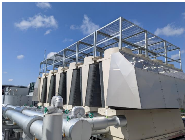
空調設備（ヒートポンプチラー）